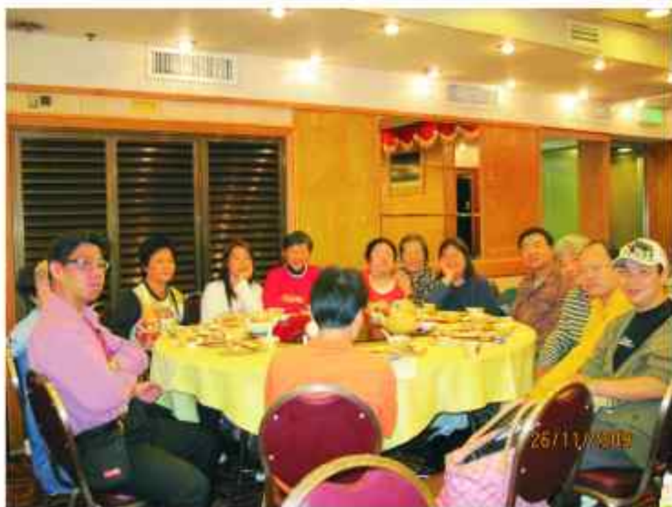
大家閒話家常，互相交流資訊，非常熱鬧

11月26日，新界西一眾會員相約在屯門市中心飲下午茶，有九龍區的會員更跨區赴會。期間，大家閒話家常，互相交流資訊，非常熱鬧！