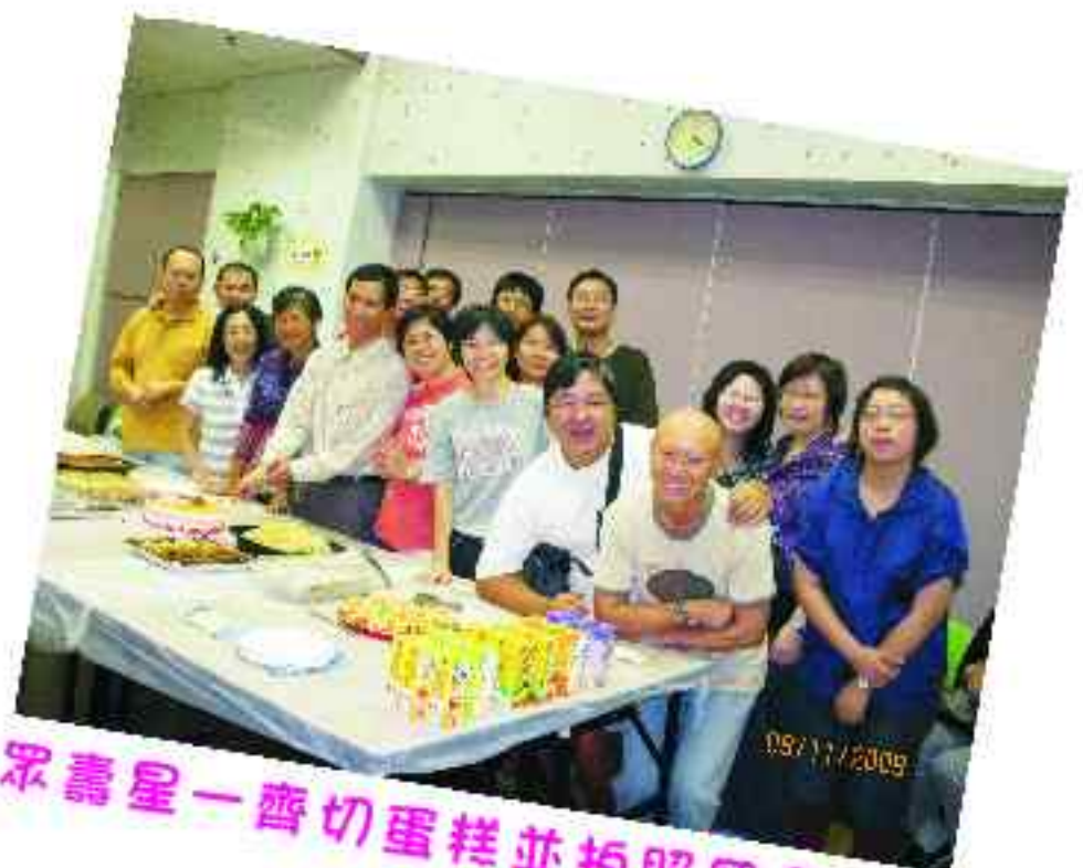
眾壽星一齊切蛋糕並拍照留念